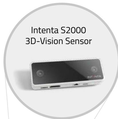
Intenta S2000 3D-Vision Sensor